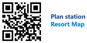
Plan station Resort Map

Téléchargez nos brochures en scannant les QR codes suivants Scan the QR codes below to download the guides