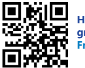
Horaires des navettes gratuites Free shuttles timetable